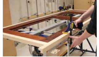
Afb. 17 Vastklemmen deur