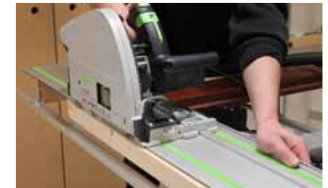
Afb. 20 Afzagen boven- en onderzijde