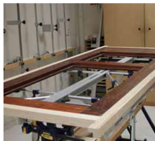
Afb. 14 Positionering deur op Inmeetmal