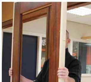
Afb. 13 Verplaatsen naar andere zijde van de deur