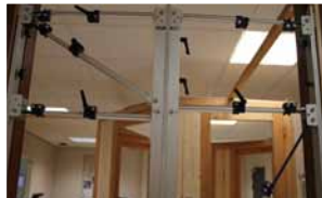
Afb. 4 Afstand buisjes bekijken