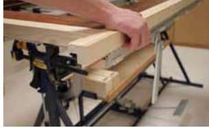
Afb. 16 Verdelen van de deur op de Inmeetmal