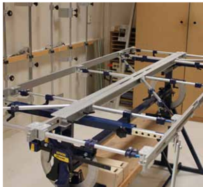
Afb. 11 Inmeetmal gepositioneerd op de draaitafel.