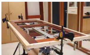
Afb. 22 Posities snelklemtangen