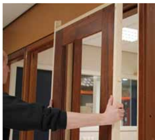
Afb. 12 Deur voor u nemen.