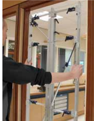
Afb. 2 Inmeetmal plaatsen in kozijn