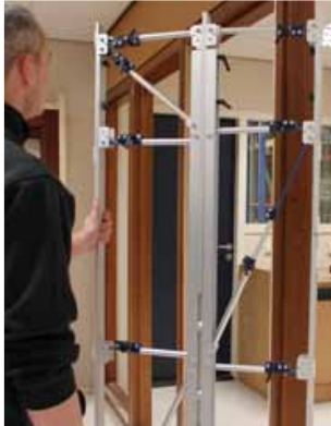
Afb. 1 Inmeetmal (klemmen aan de voorzijde)