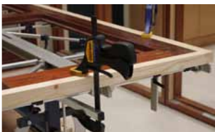
Afb. 21 Bovenzijde vastklemmen met 3e snelklemtang