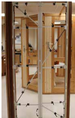
Afb. 9 Sponningmaat is gekopieerd.