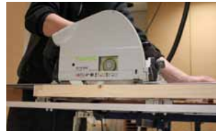
Afb. 19 Afzagen boven- en onderzijde