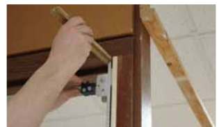
Afb. 8 Hangnaad rechts verwerken