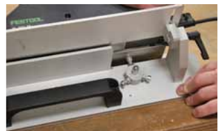
Afb. 23 Instellen Schaafmachine op gewenste schuinite