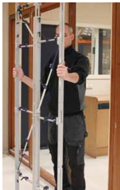
Afb. 10 Herpositionering inmeetmal