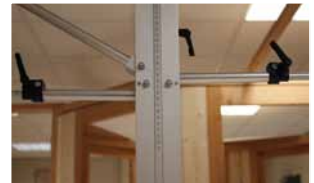
Afb. 5 Afstand tussen buisjes ongeveer gelijk