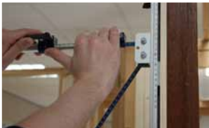
Afb. 3 Zijkant uitdrukken tegen de sponning