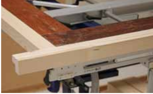
Afb. 15 Verdelen van de deur op de Inmeetmal