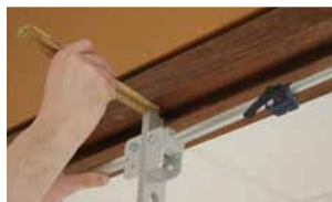
Afb. 7 Hangnaad midden verwerken