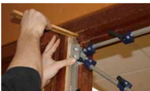
Afb. 6 Hangnaad links verwerken