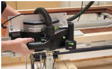
Afb. 24 Afschaven zijkant

Let op! Zorg ervoor dat de tweede geleider zo is ingesteld, dan aan beide zijden 2,5 mm van de deur over de Inmeetmal heen blijft steken.