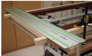
Afb. 18 Zaaggeleider

Let op! Het zaagblad moet net onder de deur komen, anders zaagt u de geleider af.